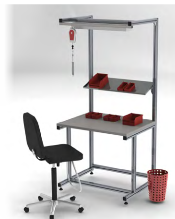
ENOSTAVNA DELOVNA MIZA Z NADGRADNJO