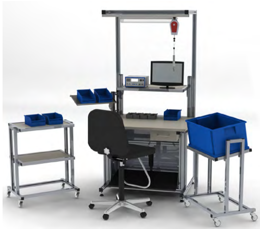
DELOVNA MIZA PO VIŠINI NASTAVLJIVA Z ELEKTRIČNIM AKTUATORJEM

Pogosto je potrebna individualna nadgradnja delovne mize s policami za zalogovnike, namenskimi šablonami, montažnimi gnezdi in pripravami, tirnico za balanser in vijačnik, osvetlitev, itd.