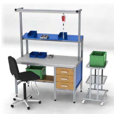
NAMENSKA DELOVNA MESTA