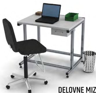
DELOVNE MIZE BREZ NADGRADNJE