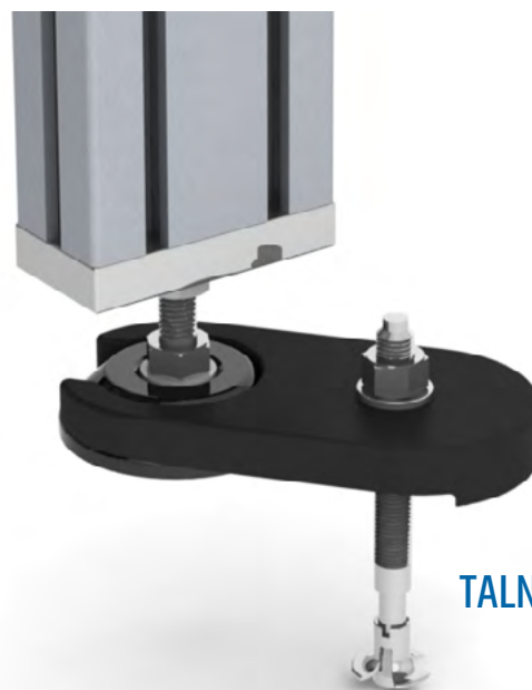
TALNI VIJAK M12